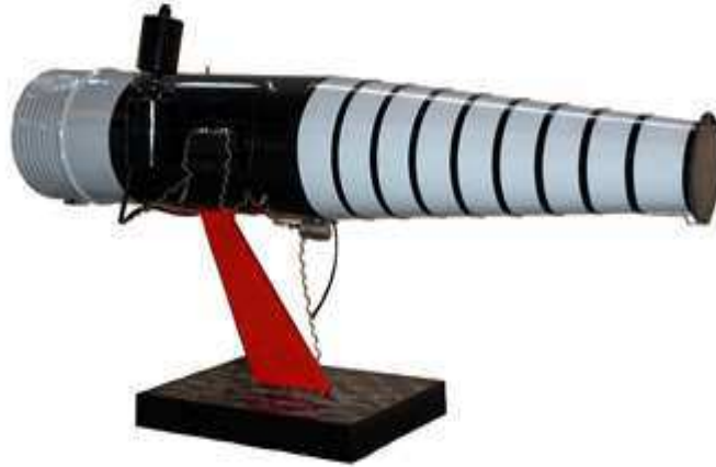
Rèplica del pulsoreactor de Ramon Casanova, exposada al vestibul del MNACTEC.