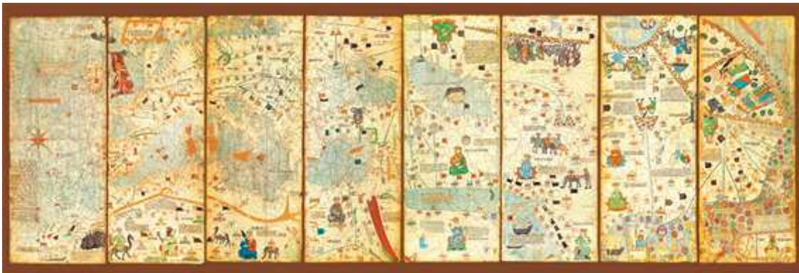
L'Atlas Català, considerat com el més antic del món i una obra mestra. Elaborat al segle XIV

Aquest àmbit proposa un cop d'ull a sis aportacions científiques i tecnològiques que, des de terres catalanes i fins a l'altra banda de món, s'han fet des de l'edat mitjana fins a la revolució industrial. Des del primer atlas del món al singular procediment de la farga catalana per obtenir un ferro de màxima qualitat.