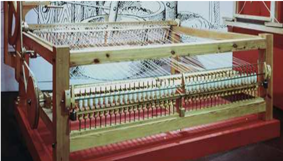
Rèplica de la berguedana exposada al MNACTEC.

La berguedana era una màquina de filar cotó que es va inventar i fabricar a Catalunya cap a l'any 1790. El seu èxit va ser absolut perquè va permetre abandonar la importació de cotó filat i especialitzar-se en el teixit i la filatura a la mateixa fàbrica.