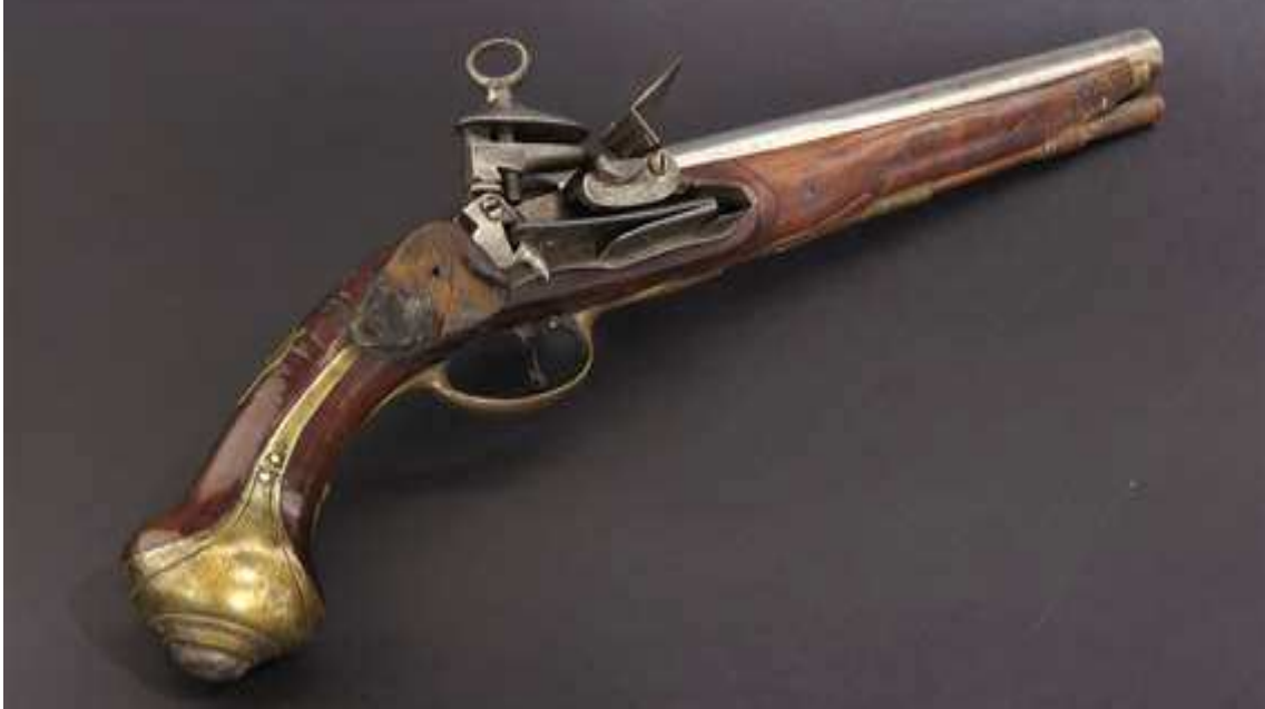
Pistola d'avantcarga amb pany de miquelet de la col·lecció del MNACTEC [c.1760-1790].

El pany és el mecanisme de les armes de foc portàtils que serveix per disparar. A mitjan segle XVII es van introduir a Catalunya alguns canvis tècnics en els models primitius de pany que van tenir un èxit considerable durant més de dos segles. Aquests panys van ser coneguts com pany de miquelet o pany a la catalana.