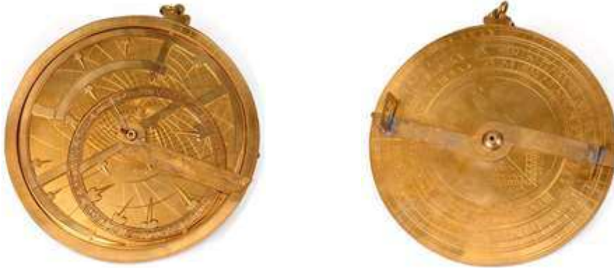
Rèplica numerada conservada al MNACTEC de l'astrolabi carolingi més antic que es coneix.

El primer astrolabi adaptat a la numeració llatina, i que prenia com a referent astronòmic el meridià de Barcelona per a tot el món occidental conegut, va ser construït a Catalunya per l'astrònom i religiós català del segle X Sunifred Llobet.